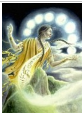
Mama Quilla, bogini festiwalu i księżycy

Podstawowe: Przekonywanie, Złodziejstwo, Ukrywanie się