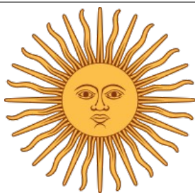
Inti, bóstwo słońca, syn Viracochy

Podstawowe: Charyzma, Walka wręcz, Siła fizyczna