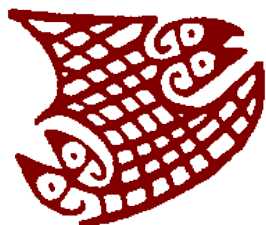
Mama Pacha, smocza bogini upraw i wydobycia, władająca trzęsieniami ziemi

Temperament wyznawcy Inti jest ognisty podobnie jak samo bóstwo. Jesteś charyzmatyczny, kiedy wygłaszasz swoje poglądy wszyscy słuchacze wykonują rzut na k6. Jeśli wyrzucą poniżej 3 przyjmują Twoje poglądy za swoje. O ile nie są skrajnie absurdalne – według uznania Mistrza Gry. Można to stosować najwyżej raz na sesję.